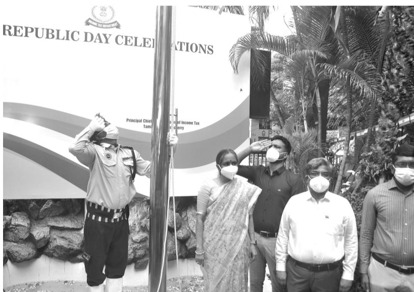
சென்னை வருமான வரித்துறை அலுவலகத்தில் தலைமை முதன்மை வருமான வரி கமிஷனர் சீதா ரவிச்சந்திரன் தேசியக் கொடியை ஏற்றி வைத்தார்.